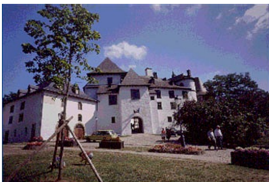
Besichtigung Burg „Bourscheid“

Fahrt quer durchs Ländchen Richtung Hotel, unterwegs